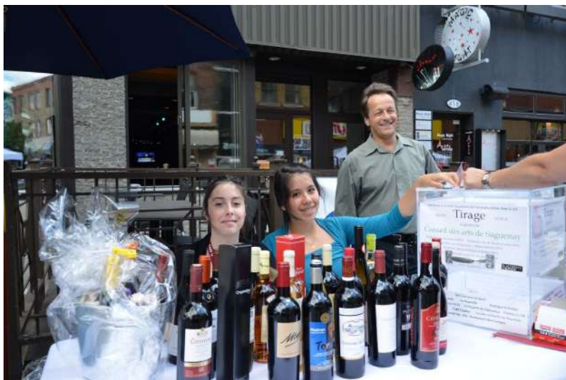
Festival des vins de Saguenay, rue Racine à Chicoutimi.

Tous ces prix étaient également accompagnés de sorties culturelles choisies.