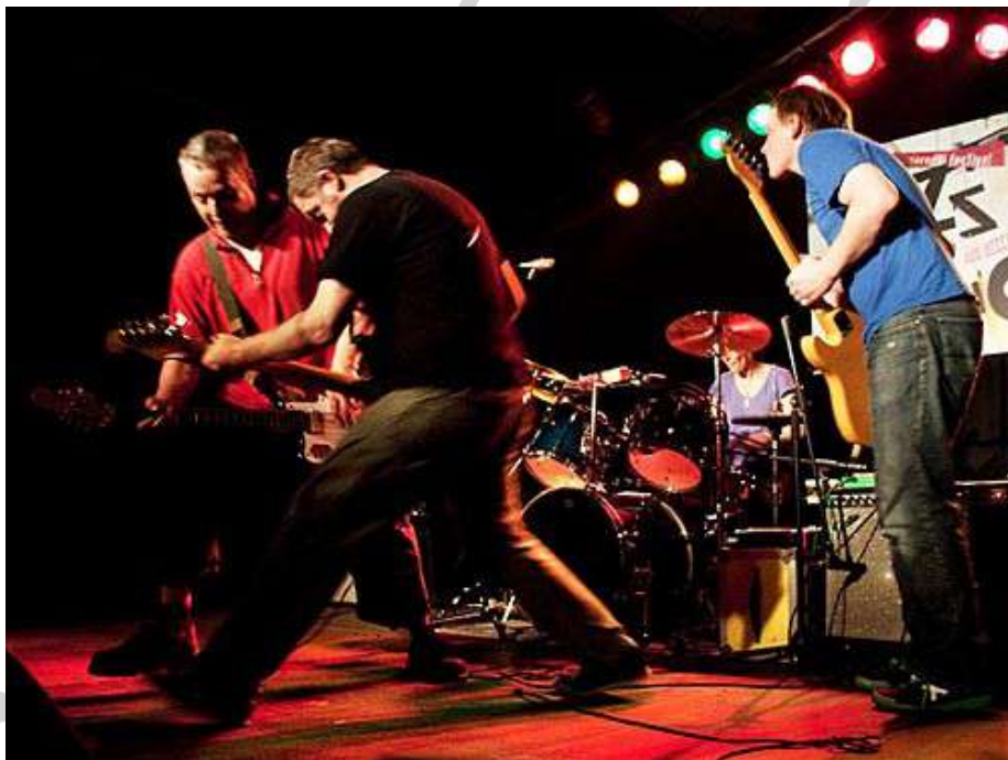
The Ex et invités / Pays Bas FMC 2011